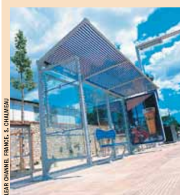
LE CAHIER DES CHARGES doit définir, entre autres indications, l'affirmation de l'identité de la ville et des lieux.

Les équipements choisis doivent comporter un minimum de pièces constitutives, chacune pouvant être remplacée indépendamment des autres. Les articulations (charnières, fermetures, fixations, etc.) doivent bénéficier d'une étude particulière.