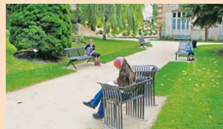
L'ÉTUDE DES USAGES et des pratiques des habitants, ainsi que l'exploitation de leurs demandes, sont indispensables à une bonne mise en place du mobilier.

Il est conseillé ensuite de faire appel à un architecte ou un paysagiste extérieur aux services municipaux et d'engager avec lui un travail en concertation. Si le choix retenu est de passer une commande directement à un fournisseur sur catalogue, il convient d'exiger certaines informations: références de réalisations; respect des normes en vigueur et certifications de la