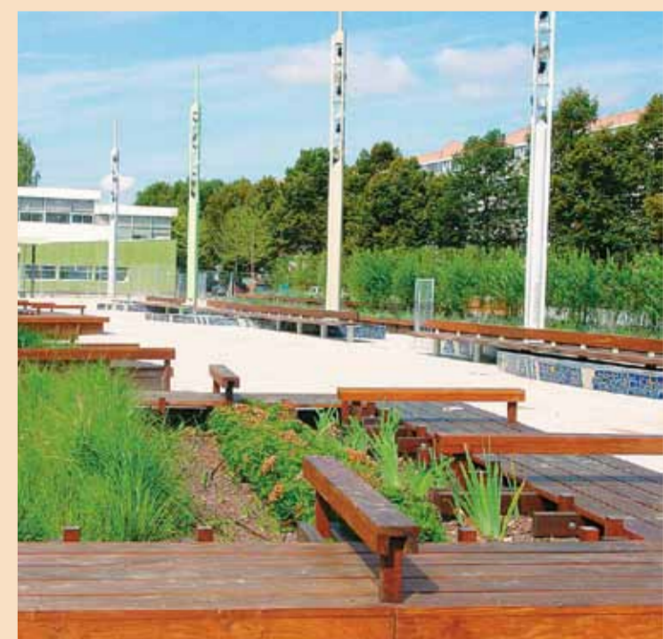
CHOISIS «SUR MESURE», LES ÉQUIPEMENTS permettent de personnaliser les lieux, mais réclament de nombreux échanges entre la maîtrise d'ouvrage et la maîtrise d'œuvre.